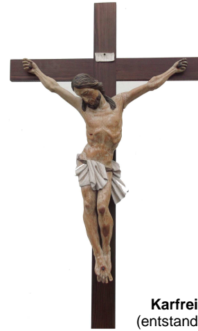
Karfreitag-Kreuz (entstanden um 1780)

mit der Leidensgeschichte nach Johannes Große Fürbitten – Kreuzverehrung - Kommunionfeier Persönliches Gebet beim Heiligen Grab