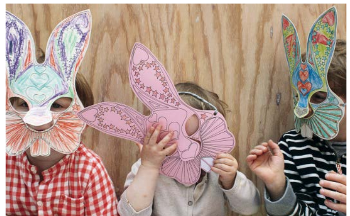
Viel Freude beim Gestalten eurer Bunny Maske!

Schneidet das Bunny an den markierten Linien aus. Die Augen und Nase lassen sich am besten mit einem Cuttermesser schneiden. Die Löcher für das Gummiband werden mit einer Lochzange oder einem einfachen Bürolocher gestanzt. Danach wird das Gummiband durch die Löcher gefädelt. Fertig!