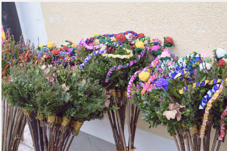
Palmsonntag, 24.03. um 08:45 Uhr