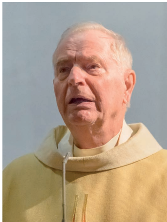
Pfarrer 1970 - 1998

Für mich ist der gesamte Altarraum, diese Geschlossenheit von Altar - Ambo - Priestersitz, von besonderer Bedeutung. Gerne habe ich dort Gottesdienst gefeiert. Bei Kindergottesdiensten bin ich dann zu den ersten Bankreihen hinunter gegangen, um die Distanz zu durchbrechen.