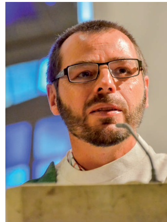
Pastoralassistent 2004 - 2014