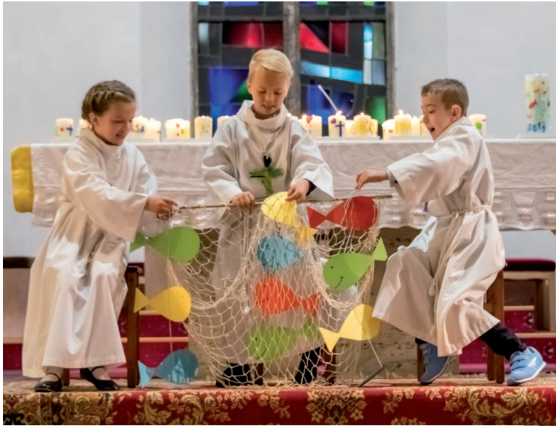
Erstkommunion mit Jesus vernetzt