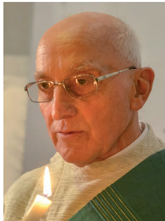
Pastoralassistent 1995 - 2002

Ich erlebe unseren Kirchenraum als einen „hehren“ Raum, der meine Aufmerksamkeit bekommt. Die Länge, die Höhe, die Glasfenster in der Apsis ziehen mich nach vorn, vor allem aber das Kreuz, das im Mittelpunkt hängt.