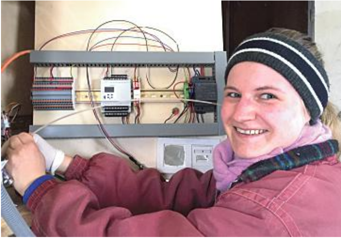
Bald werde es Licht!