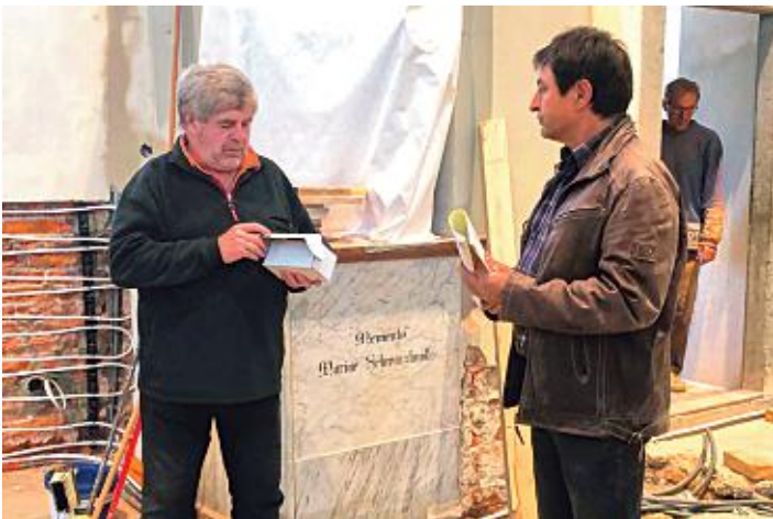
Auch "ERNSTE" Gespräche sind nötig.