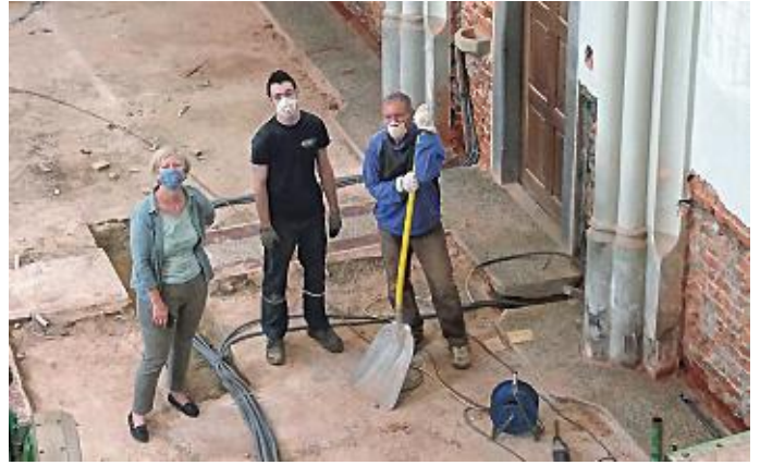
Aus der Sicht von oben!