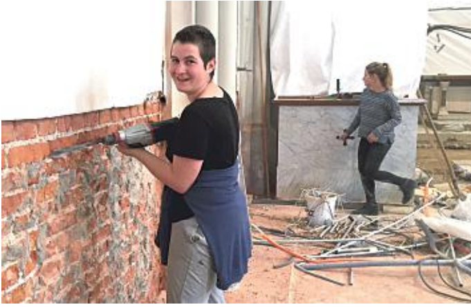
Stemmen ist nicht nur was für Männer.