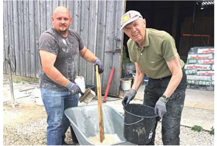
Werkzeugwaschen ist dafür keine Lieblingsbeschäftigung der Männer.