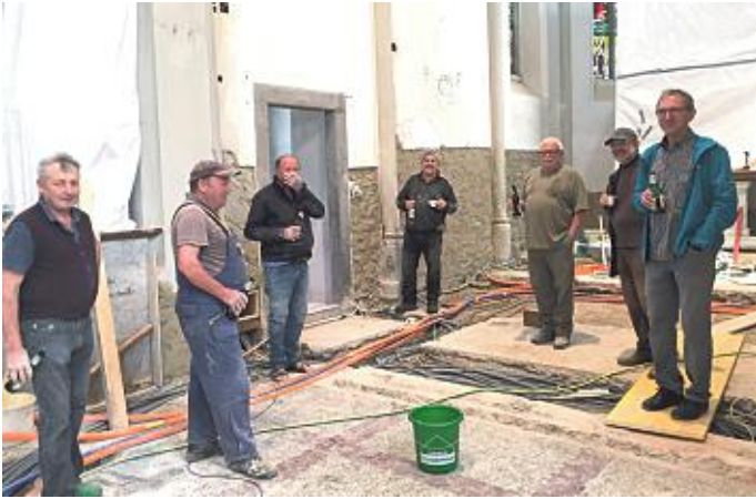
Auch Pause muss mal sein.