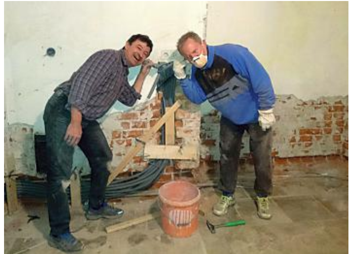
Hörst du schon was???