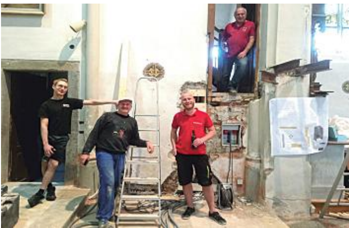
Aus Sicht der Kanzel!