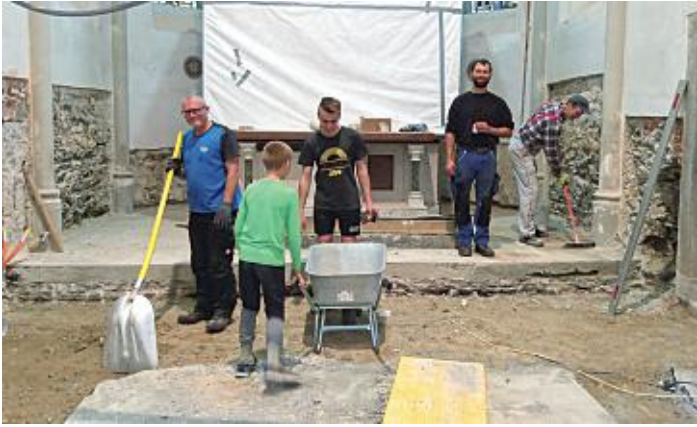
Arbeiten im Presbyterium