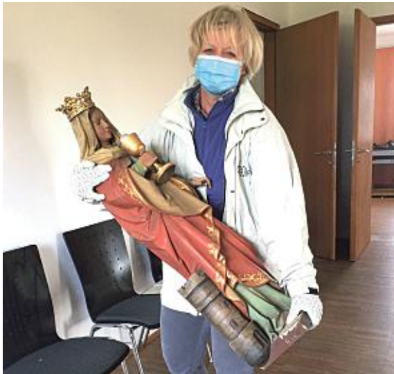
Die Heiligenstatuen werden im Pfarrhof sicher aufbewahrt.