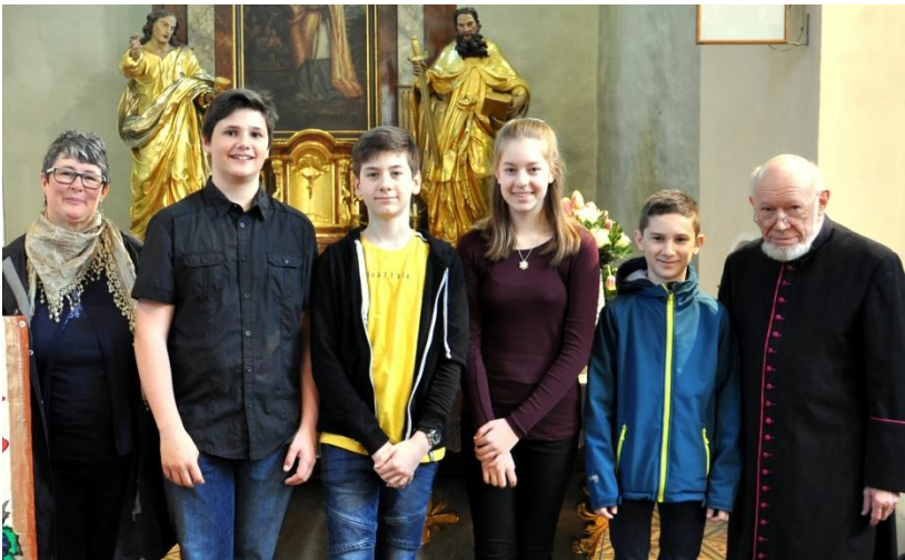
Unsere Firmkandidaten bei der Vorstellungsmesse

Die Firmvorbereitung dauert ein halbes Jahr. Sie ist Jahr für Jahr ein wichtiger Beitrag zur Weitergabe unseres Glaubens. In dieser Zeit helfen die Firmkandidaten bei mehreren Aktionen der Pfarre mit. Die Pfarrgemeinde nimmt die Gefirmten als vollwertige Christen an.