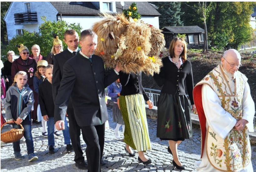
Nach einem schwierigen Sommer danken wir für die Ernte.

Wo Menschen zusammenhelfen und zusammenhalten, können sie geistlich und materiell auf eine gemeinsame Ernte blicken. In den Bitttagen haben wir Gott gebeten, jetzt dürfen wir danken.