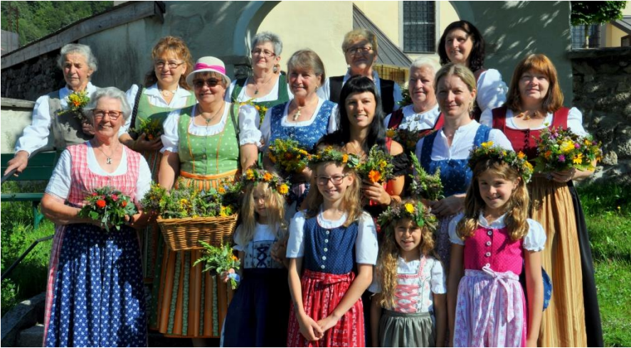
Blumen und Kräuter zum Fest Mariä Himmelfahrt

Wo Menschen zusammenhelfen und zusammenhalten, können sie geistlich und materiell auf eine gemeinsame Ernte blicken. In den Bitttagen haben wir Gott gebeten, jetzt dürfen wir danken.