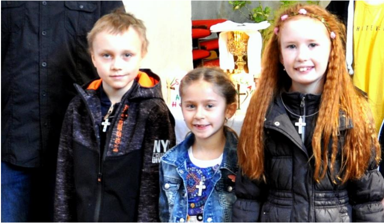
Vorstellung der drei Erstkommunionkinder

Heuer konnten wir in der Erstkommunion drei Kinder in die volle Eucharistiegemeinschaft aufnehmen. Sie sind für uns ein Zeichen der Hoffnung für den Glauben von morgen.