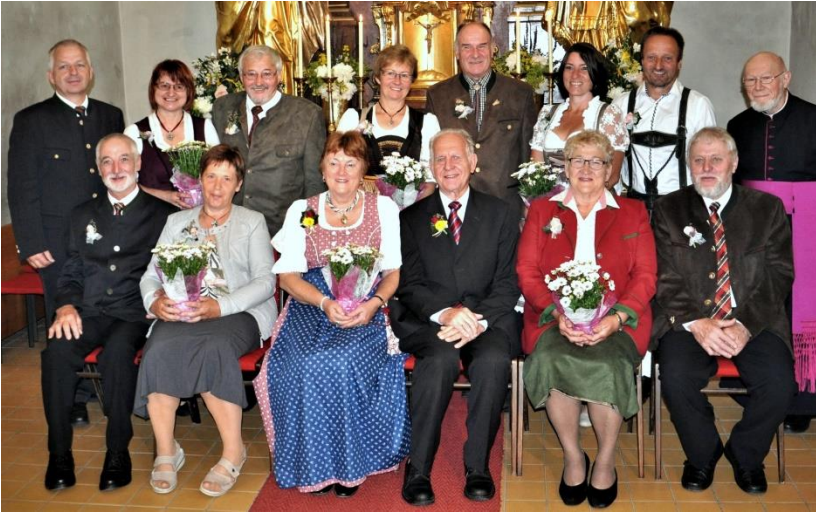
Die Ehejubilare des Jahres 2019

Wir danken allen Familien, die unserer Gesellschaft festen Halt geben. Wir freuen uns auch, wenn die neue Generation die Liturgie begleitet. Alt und Jung finden zusammen beim Fronleichnamsfest. Als Christen dürfen wir uns freuen: Gott geht mit uns durch unser Leben.