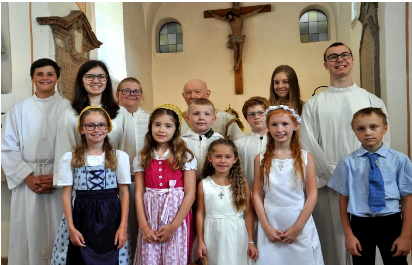
Fröhliche Gesichter nach der Fronleichnamsprozession

Wir danken allen Familien, die unserer Gesellschaft festen Halt geben. Wir freuen uns auch, wenn die neue Generation die Liturgie begleitet. Alt und Jung finden zusammen beim Fronleichnamsfest. Als Christen dürfen wir uns freuen: Gott geht mit uns durch unser Leben.