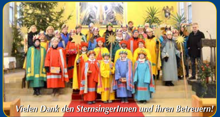
Vielen Dank den SternsingerInnen und ihren Betreuern!