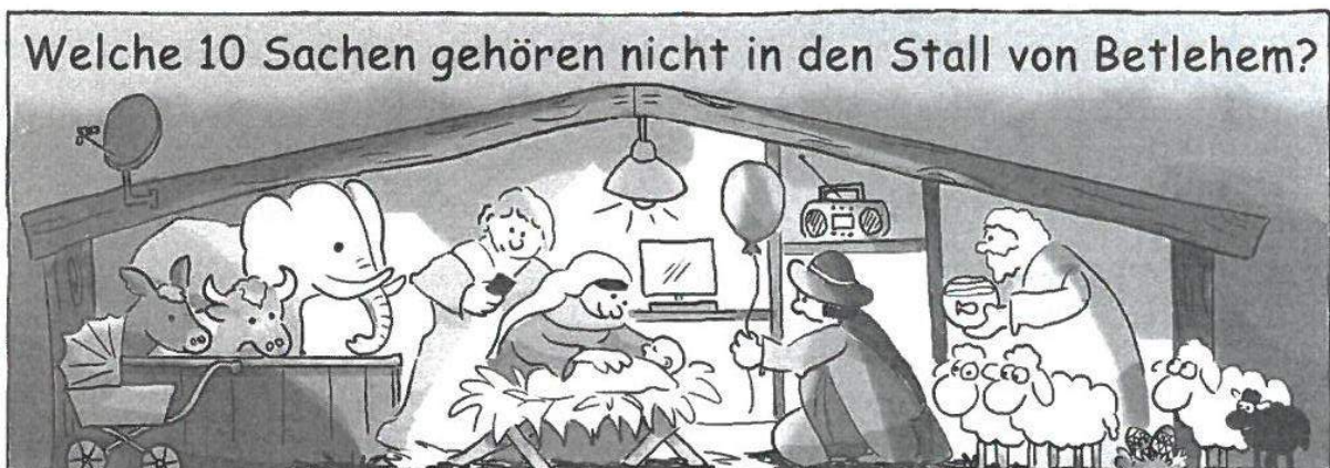
(Satellitenschüssel, Kinderwagen, Kinderschüssel, Elefant, Handy, Radio, Goldfisch, Ostereier)