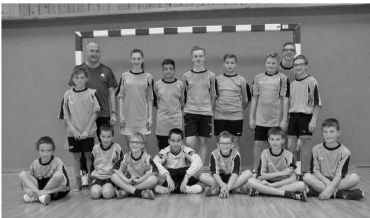
Die siegreichen Fußballminis aus Unterweißenbach