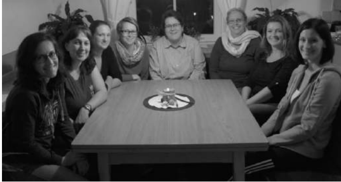
Das aktuelle Kinder- und Familienliturgieteam

Die monatlichen Kinderwortgottesdienste im Pfarrheim beschäftigen sich immer mit einem Jahresthema. Dieses Jahr begleitet uns das Thema „Wer war Jesus?“