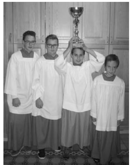
Stolz präsentieren unsere Minis den „Hansjörg-Pokal“

Wie bereits im Vorjahr gewannen auch heuer die Unterweißenbacher Fußballminis.