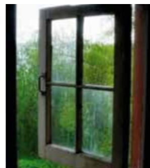
Wir erwarten vom Konzil, das es frische Luft herein lässt! Papst Johannes XXIII.