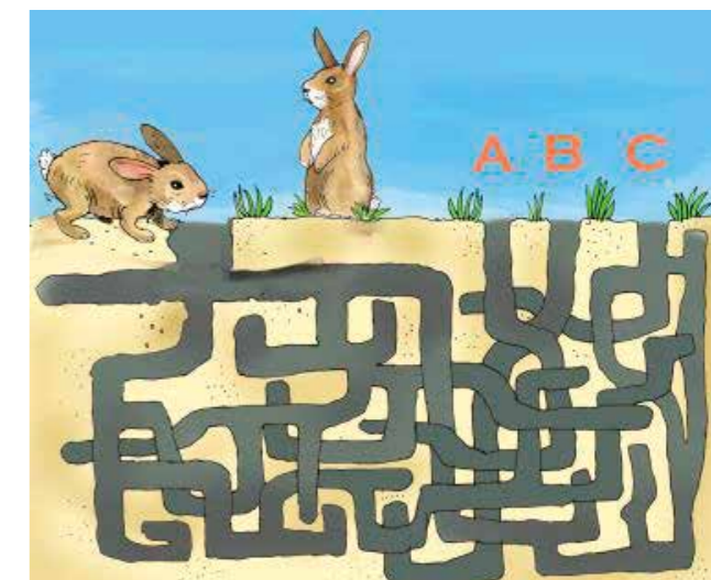
(Auflösung: Ausgang C)

Christian Badel, www.kikifax.com , In: Pfarrbriefservice.de