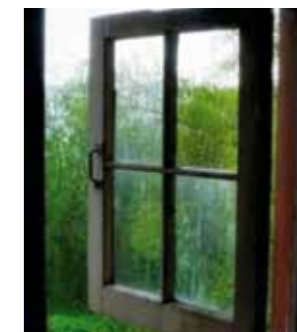
Wir erwarten vom Konzil, das es frische Luft herein lässt! Papst Johannes XXIII.