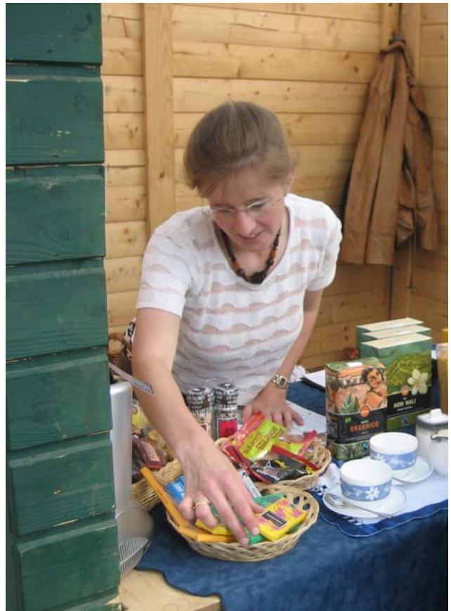
Verkauf von Fairtrade Produkten am Bauern- und Schmankerlmarkt beim

Der zweite Schwerpunkt des Fachausschusses „Eine Welt“ liegt in der Werbung und im Verkauf von Eine Welt Produkten. Regelmäßig werden diese fair gehandelte Produkte, wie Kaffee, Gewürze und vieles mehr, am Bauern- und Schmankerlmarkt beim Generationenzentrum angeboten. Dieser gut besuchte Markt findet auch 2009 wieder von April bis Septem-