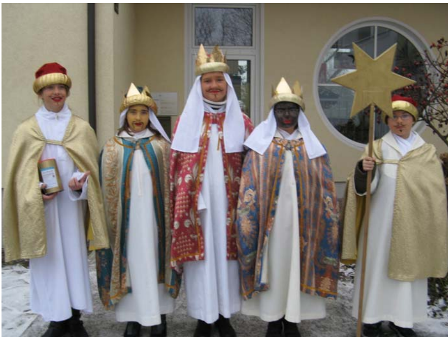
Fleißige Sternsinger bei der Dreikönigsaktion 2009

Im Fachausschuss „Eine Welt“ engagiert man sich dafür, dass es in Zukunft nicht mehr 3 Welten, sondern eine gemeinsame, bessere Welt gibt.