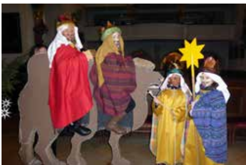
Das Kamel am 6. Jänner darf nicht fehlen

An 3 Tagen waren 19 Gruppen mit je einer Begleitperson mit vollem Eifer und Begeisterung dabei. Insgesamt waren heuer in Oberösterreich über 16.000 Kinder und Jugendliche für die Dreikönigsaktion unterwegs und österreichweit circa 85.000.