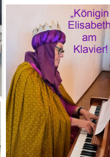
„Königin Elisabeth“ am Klavier!