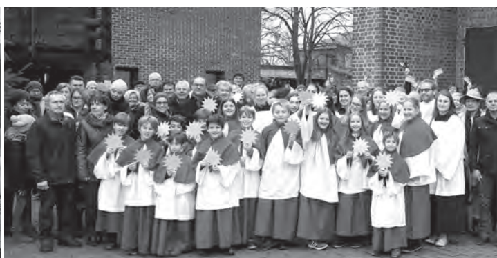
Gottesdienstgemeinde St. Josef, Pernau Wels

sechs Pfarren des Dekanats zusammen, um die Bedeutung des Sonntags wieder hervorzuheben. Mit Postkarten und mit einer Fotoaktion der Gottesdienstgemeinde wurde auf den freien Sonntag aufmerksam gemacht, mit dem Ziel, in Zukunft hier keine verkaufsoffenen Sonntage in der Adventszeit zu genehmigen. Über 300 Postkarten und einige Fotos aus den Pfarren wurden an den Herrn Bürgermeister verschickt.