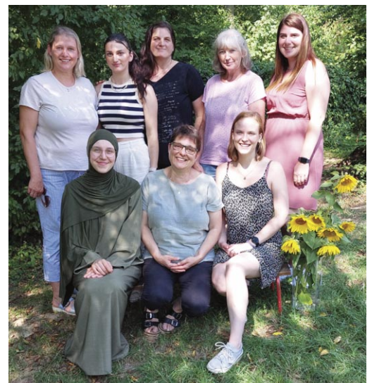
Das Team des Kindergartens