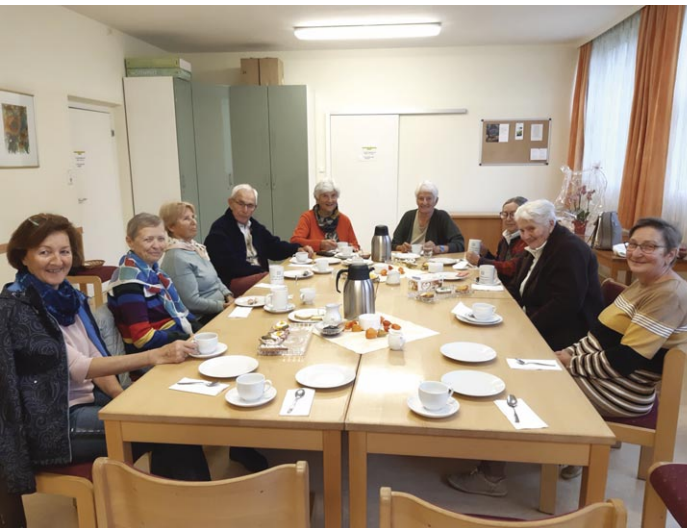
Das Frühstück nach dem Gottesdienst jeden letzten Donnerstag im Monat erfreut sich großer Beliebtheit. Alle sind herzlich dazu eingeladen.