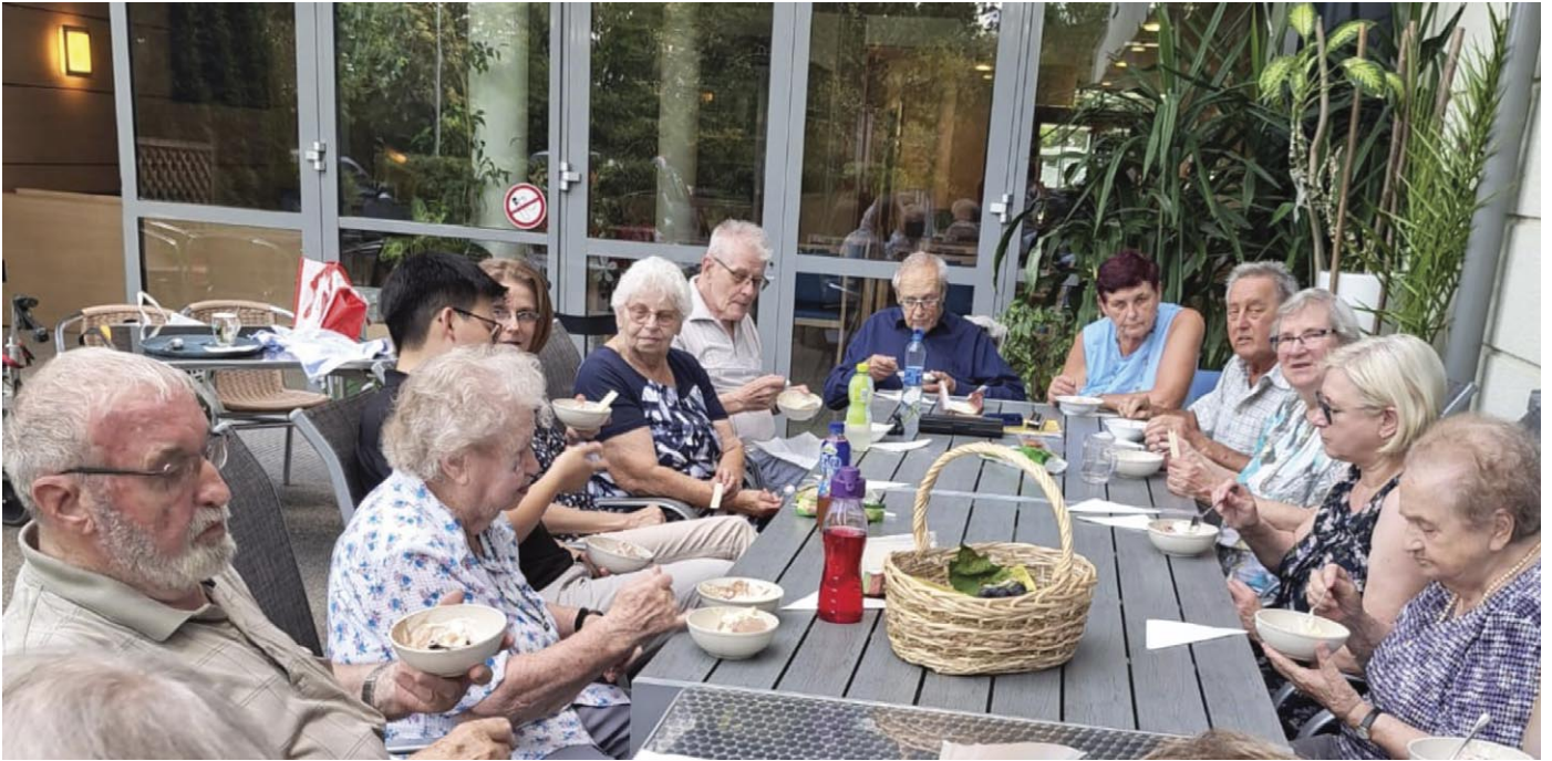
Die regelmässigen Gottesdienstbesucher, im Alten- und Pflegeheim am Freitag um 15:00 Uhr, sind eine nette Gemeinschaft.