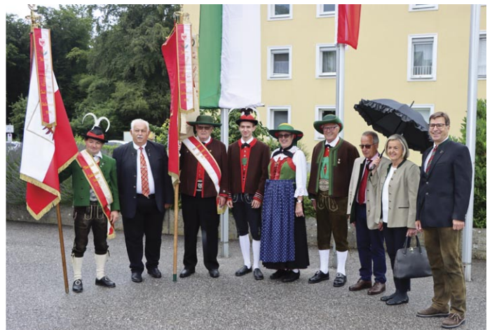
Abordnungen der Goldhaubengruppe Steyr und der Südtiroler Verbände.