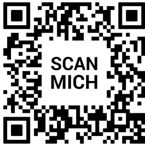
QR Code Pfarr-Homepage