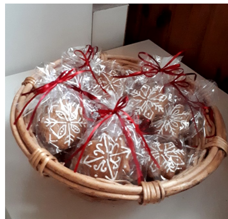
Selbstgebackene Lebkuchen wurden am 8. Dezember verteilt.