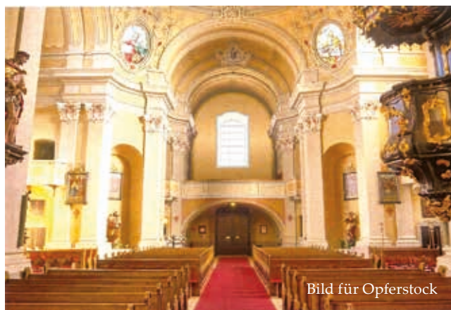
Bild für Opferstock

In der Diskussion um eine neue Orgel, eine einfache-