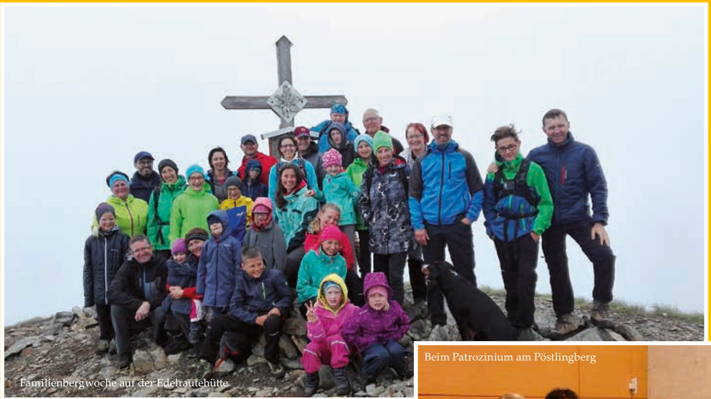
Familienbergwoche auf der Edelrautehütte