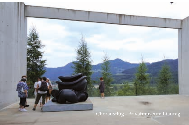
Chorausflug - Privatmuseum Liaunig