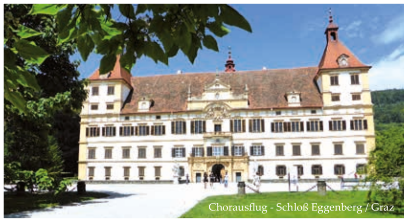
Chorausflug - Schloß Eggenberg / Graz