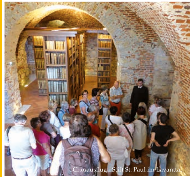
Chorausflug - Stift St. Paul im Lavanttal

Erscheinungsort: Linz-Pöstlingberg / Verlagspostamt: 4040 Linz P.b.b. GZ 02Z030687 DVR: 0029874 (1012)