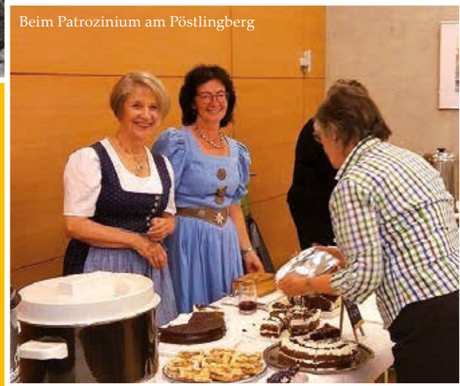
Beim Patrozinium am Pöstlingberg