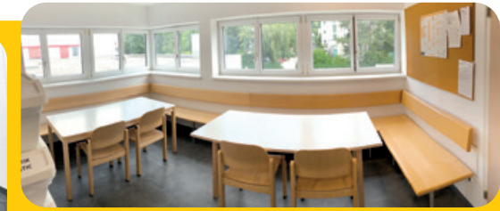
Gemeinschaftsküchen in den Etagen