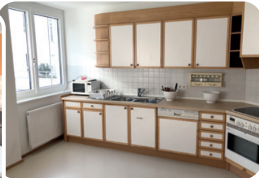
Die original Gemeinschaftsküche im Erdgeschoß.