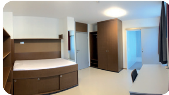
Großes Einzelzimmer im Erdgeschoss.

Alle 64 Einzelzimmer teilen sich in Zweierwohngruppen sowie in Einzelzimmer in verschiedenen Größen, Aufteilungen und Ausrichtungen auf, sind möbliert und auf vier Stockwerke aufgeteilt. Internetzugang/Serverdienste sowie LIWEST-TV-Anschluss sind in der Miete inkludiert. Bettwäsche und Überzüge bringst du mit, Nass- und Vorraum werden in regelmäßigen Abständen von uns gereinigt.