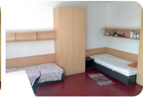
Doppelzimmer mit Schreibtischen, zwei Betten und Schränke sowie Zugang zur Terrasse und Garten.