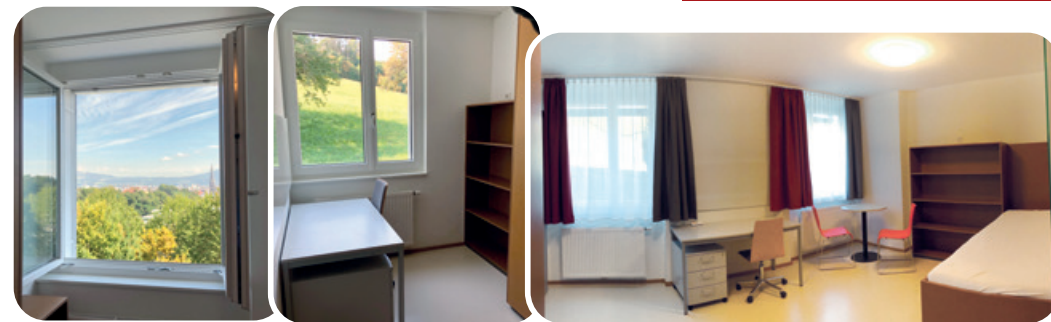
Alle Einzelzimmer mit Ausblick ins Grüne.