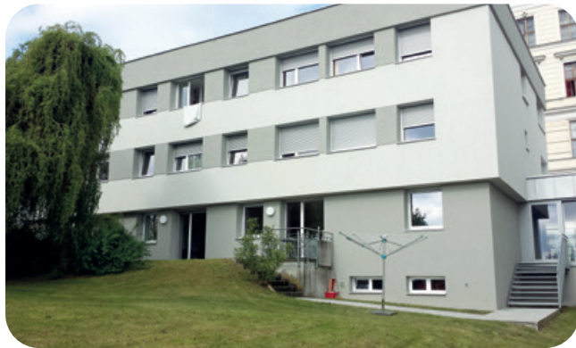
Auf der Rückseite des Wohnheims erwartet dich ein großer Garten.