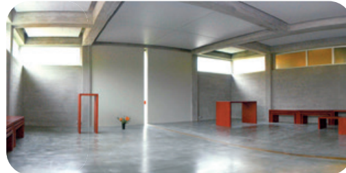
Raum der Stille

Die ehemalige Hauskapelle der KHG Linz wurde zum interreligiösen „Raum der Stille an der Universität“ und steht Angehörigen aller Religionen offen.