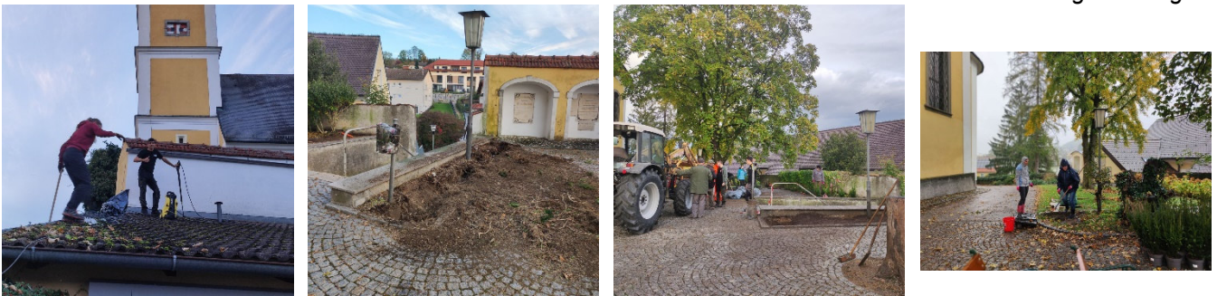
Das Team Gartengestaltung

Ein großer Dank allen Helfer:innen für ca. 250 Arbeitsstunden bei teilweise strömendem Regen. Vielen Dank auch an Adrian Prepelita für die Spende der Heckenpflanzen und der Stadtgemeinde Ansfelden für die zugesagte Unterstützung.