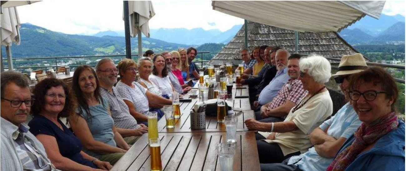
Chor-Ausflug, Juni 2022, Feste Hohensalzburg