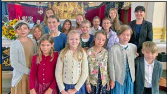
Siehe Seite 5