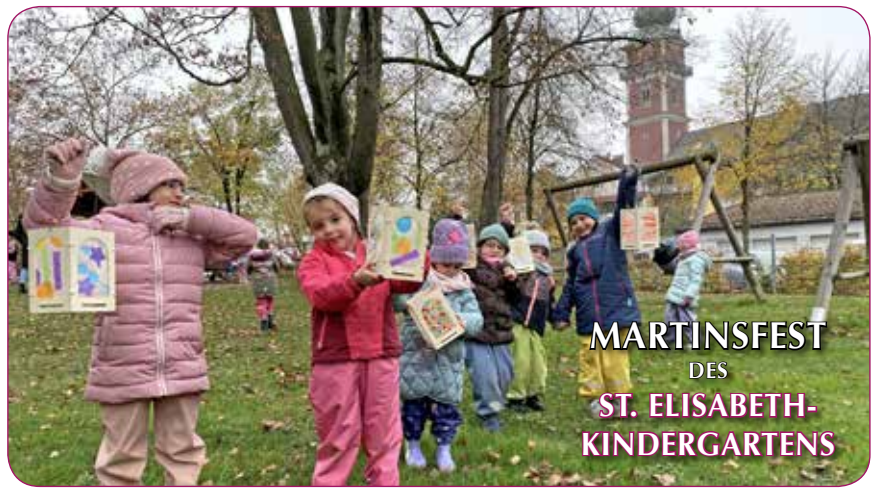
MARTINSFEST DES ST. ELISABETH- KINDERGARTENS