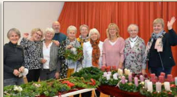
Siehe Seite 12