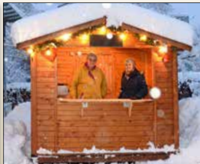
... am Riedberg – siehe Seite 14