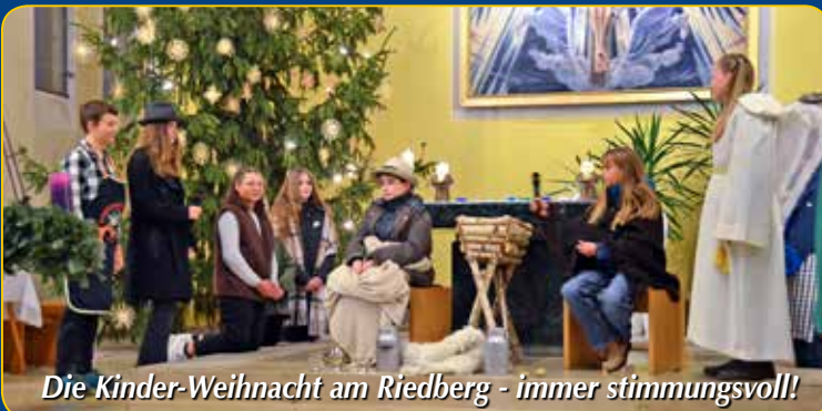
Die Kinder-Weihnacht am Riedberg - immer stimmungsvoll!