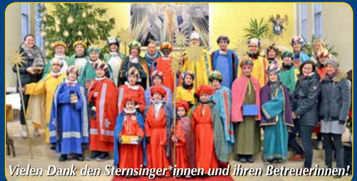
Vielen Dank den Sternsinger*innen und ihren Betreuerinnen!