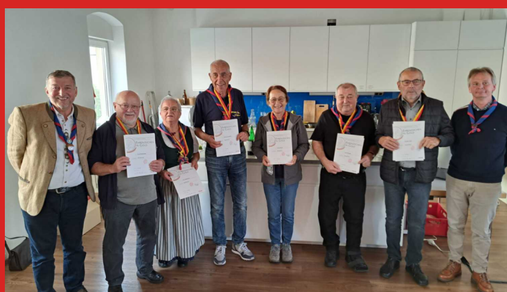
Ehrung Pfadi Elternrat