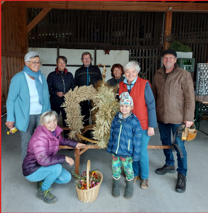
Team Erntekrone binden