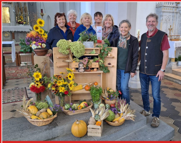
Team Kirchenschmuck zum Erntedank