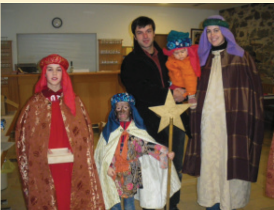
Die Sternsinger unserer Pfarre konnten durch ihren persönlichen Einsatz € 19.743,- für Not leidende Menschen sammeln