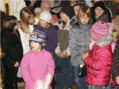
Voller Erwartung auf das große Fest waren die kleinen und größeren Besucher bei der Kindermette am 24. Dezember