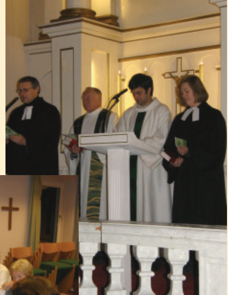
Der ökumenische Gottesdienst anlässlich der Gebetswoche für die Einheit der Christen wurde heuer in der evangelischen Kirche und anschließend im Gemeindezentrum gefeiert