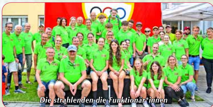
Die strahlenden die Funktionär*innen