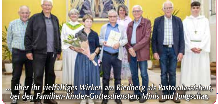
... über ihr vielfältiges Wirken am Riedberg als Pastoralassistent, bei den Familien-Kinder-Gottesdiensten, Minis und Jungchar.