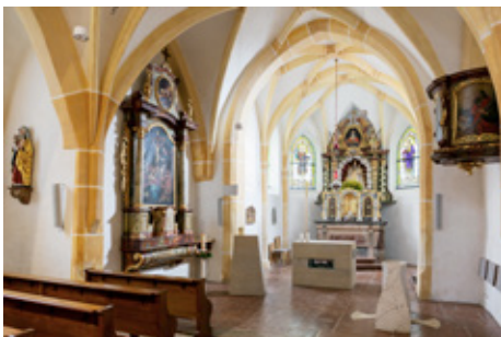
Einblick in den Altarraum der Kirche Richtung Nordosten

Im Barock wurde der dachreiterartige Glockenturm aufgesetzt. Die zweigeschossige Sakristei an der Südseite besteht im Kern schon seit der Gotik und wurde laut einer Inschrift an der Fassade zuletzt 1908 umgebaut. Die an Blätter aus Papier erinnernden Kirchentüren sind Teil der Neugestaltung von 2016.