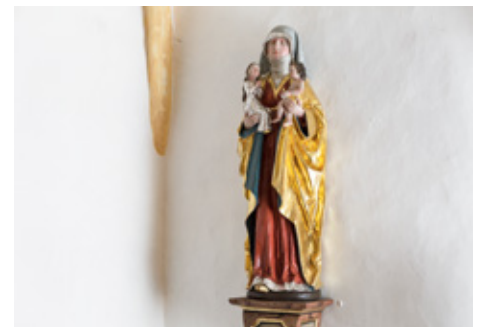
Hl. Anna selbdritt, Gipsabguss einer spätgotischen Skulptur

Die Dreiergruppe wird auch als irdisch-weibliches Pendant zu männlich-göttlichen Trinitätsdarstellungen gesehen. Insbesondere zum Gnadenstuhl, bei dem Gott Vater ein Kreuzifix hält und so auf den Opfertod Christi verweist. Anna selbdritt hingegen verkörpert dessen Geburt und Inkarnation.