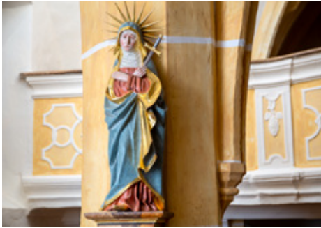
Mater Dolorosa, spätgotische Holzskulptur mit erneuerter Fassung

Ikongraphische Quelle dieser Darstellung, die Maria mit einem Schwert in der Brust zeigt, ist das aus dem Mittelalter stammende Gedicht Stabat mater :