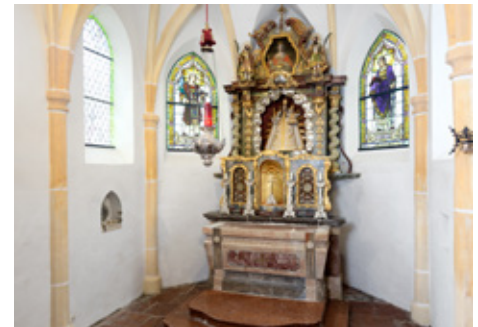
Ehemaliger Hochaltar, aus Teilen unterschiedlichen Alters zusammengesetzt

Das gotische Altarfenster (Chorscheitelfenster), durch welches ursprünglich das Licht in den Altarraum fiel, wurde im Barock durch den Hochaltaraufbau verstellt. Das Licht wurde durch ein Bild ersetzt.