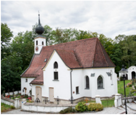
Außenansicht der Kirche, Blickrichtung Westnordwest

Abseits vom Dorf steht die Kirche von St. Radegund auf der Geländestufe eines Steilhanges, der zur Salzach weist. Ohne den heutigen Baumbestand wäre ihre Position vom Fluss aus gut sichtbar. Sie ist nach Nordosten ausgerichtet, wo sich am Hang oberhalb der Kirche eine kleine Senke befindet. In dieser Richtung geht der Mond bei einer Nordwende auf.