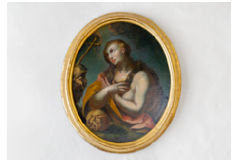
Büßende hl. Maria Magdalena, Oberbild des ehemaligen rechten Seitenaltares

2016 wertete Papst Franziskus ihren Gedenktag zum Fest auf, wodurch sie, was den Rang ihres Gedenkens im Heiligenkalender betrifft, den Aposteln gleichgestellt wurde.