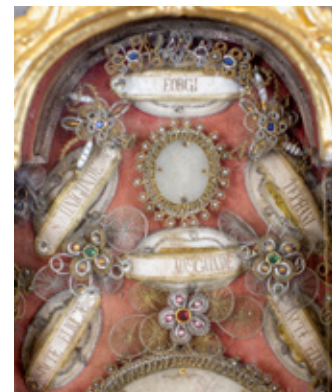
Sammelreliquiar in einem Rokoko-Glasschrein des Hochaltars. Das Mittelstück bildet eine Reliquie der hl. Radegunde.

Erst die Kreuzzüge, durch die bedeutende Reliquien aus dem Heiligen Land nach Europa kamen, brachten eine grundlegende Veränderung mit sich. Unter dem Einfluss byzantinischer Präsentationsformen, die den visuellen Kontakt mit unverhüllten Knochen ermöglichten, wurden auch im Westen verglaste Schaugefäße üblich. Diese Reliquiare sind nicht mehr Grab, sondern dienen der Sichtbarmachung des Auratischen.