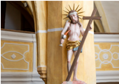
Christus als Schmerzensmann mit Kelch („Eucharistischer Schmerzensmann“), spätgotische Holzskulptur, um 1520, neu gefasst

(Gereimte Übersetzung von Christoph Martin Wieland , 1779)