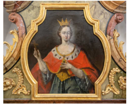
Hl. Radegundis, Oberbild des ehemaligen Hochaltars

Franz Jägerstätter hat sich intensiv mit Heiligenlegenden befasst. Es könnte gut sein, dass er die entsprechende Stelle in der Vita der hl. Radegundis kannte, da diese in vielen Heiligenlegenden-Büchern seiner Zeit erwähnt wurde.