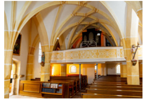
Einblick in das Langhaus Richtung Südwesten

Auf diesem Foto, das einen Einblick in das Langhaus vom Altarraum aus zeigt, kann man die Größe des früheren Saalraums gut ermessen. Durch die später eingestellten Pfeiler entstand daraus ein dreischiffiger Raum. Im Barock wurde eine Orgelempore mit mittig vorschwingender Brüstung eingebaut. In der Gotik gab es ein dem Hochaltar gegenüberliegendes Eingangsportal, das später zugemauert wurde.