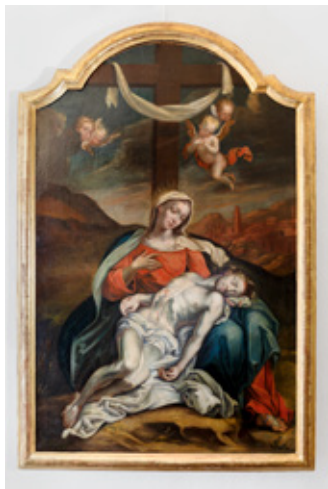
Pietà, Anfang 19. Jh.

Der Schmerzensmann , der sein Blut in einem Kelch auffängt, ist eine Bild-erfindung des späten Mittelalters. Er versinnbildlicht die Passion Christi und die Vergegenwärtigung dieses Opfers in der Eucharistie.