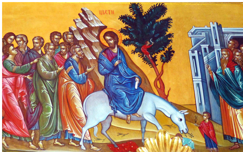
Einzug Jesu in Jerusalem