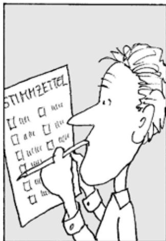
QUAL DER WAHL?