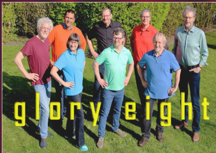
Vocal - Instrumental - Ensemble

Pfarre Allerheiligen - gemeinsam mit dir