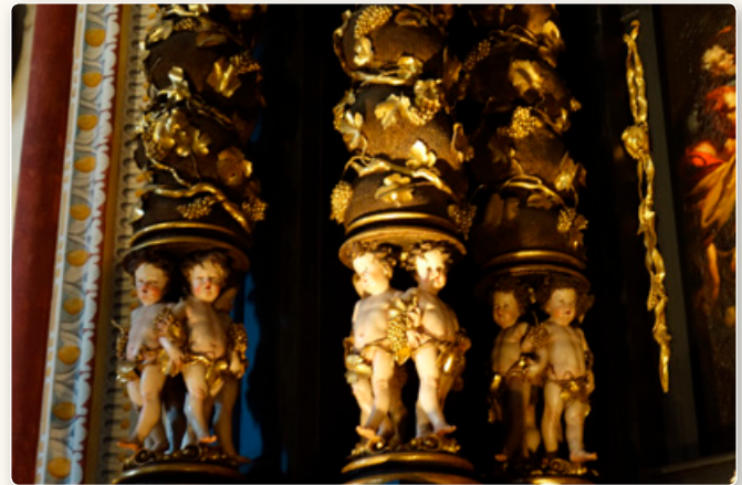
Bild: Corpus Christi-Altar