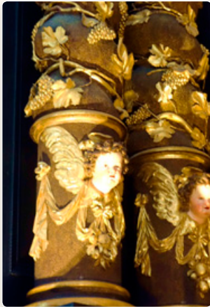
Bild: Arme Seelen-Altar

füllt 1683 am Arme Seelen-Altar den Unterteil mit geflügelten Engelsköpfen, Bändergehängen und darunter einem Fruchtgehänge vollständig aus. Überdies sind die Engelsköpfe an den inneren Säulen zum Altarbild gewandt, so dass der Blick dadurch zur Mitte geführt wird.