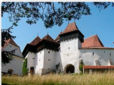
Bild: Kirchenburg von Viscri (Deutsch-Weißkirch, Siebenbürgen) GNU Free Documentation License

Die Texte zweier Kirchenlieder spiegeln zwei Kirchenbilder wider, die sich konträr gegenüberstehen: