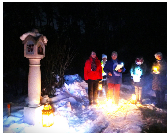
Eure KFB Langholzfeld