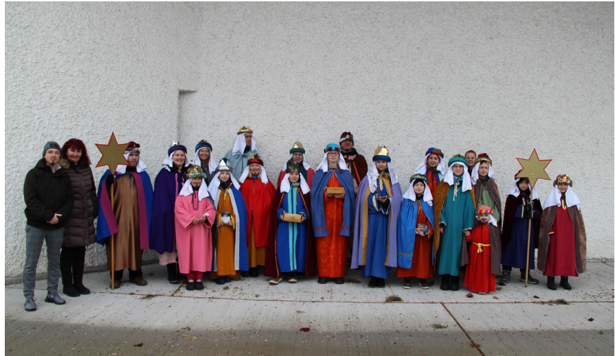
Mit 8368,- Euro - ein Rekordergebnis - lieferten die Starnsinger:innen 2024 einen wichtigen Beitrag zum Gemeinwohl und ganz viele Jungschar Kinder waren mit dabei - DANKE!

„Ach...wie die Zeit vergeht. Ein paar Jungschar Kinder wachsen schon langsam aus dem Jungscharalter heraus. Doch, wie soll es jetzt weitergehen? Natürlich ist noch lange an kein Ende zu denken. Eine Jugendgruppe ist angedacht, deren neues Zuhause der Jugendraum im Pfarrkeller werden soll. Der Gedanke, dass die bald entwachsenen Jungschar Kinder als tatkräftige Jugendliche und mögliche