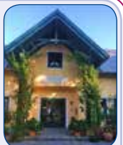
„Ein Haus voll Glorie schauet ...“ romantisches Pfarrheim Trumau Baden/Wien

Wir werden also unsere Stadtpfarr-Priester stets herzlich einladen, dass einer nach Möglichkeit seines Terminkalenders bereichernd vorbei schaut.