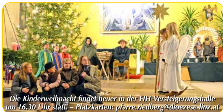
Die Kinderweihnacht findet heuer in der FIH-Versteigerungshalle um 16.30 Uhr statt. – Platzkarten: pfarre.riedberg@diözese-linz.at