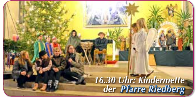
16.30 Uhr: Kindermette der Pfarre Riedberg

Wir haben uns in den beiden Pfarren Stadtpfarre Ried und Pfarre Riedberg Gedanken gemacht, wie wir Weihnachten feiern können.