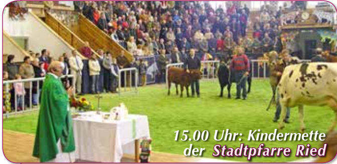
15.00 Uhr: Kindermette der Stadtpfarre Ried

Wir haben uns in den beiden Pfarren Stadtpfarre Ried und Pfarre Riedberg Gedanken gemacht, wie wir Weihnachten feiern können.