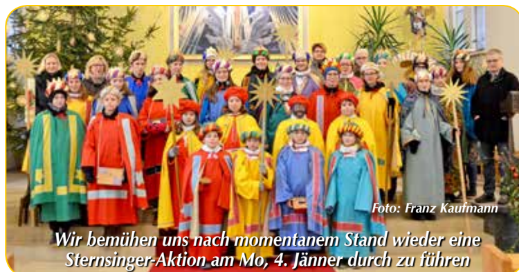
Wir bemühen uns nach momentanem Stand wieder eine Sternsinger-Aktion am Mo, 4. Jänner durch zu führen