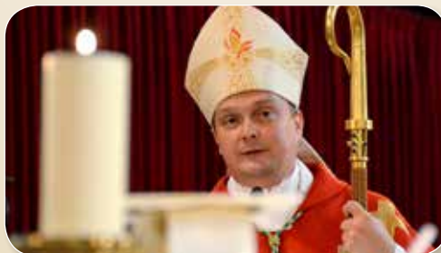
Lesen Sie auf Seite 4