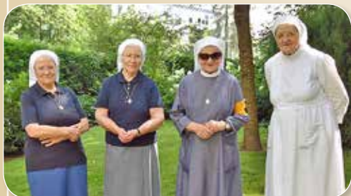
Lesen Sie auf Seite 3