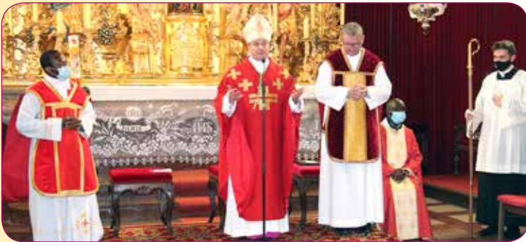
Die Firmung um 14.00 Uhr der Firmlinge der Pfarren: Stadtpfarre Ried im Innkreis und Pfarre Hohenzell.