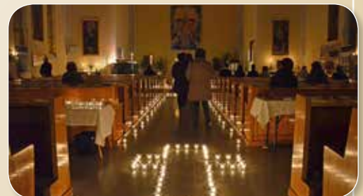
Lesen Sie auf Seite 11