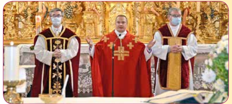
Die Firmung um 16.00 Uhr die Firmlinge der Pfarren: Pfarre Riedberg und Pfarre Neuhofen.