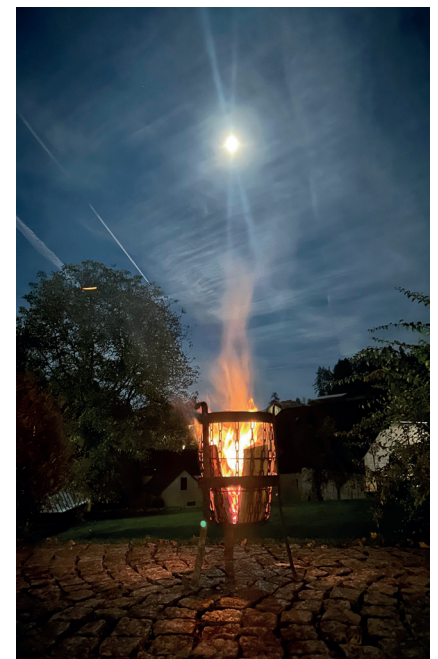
Ein lichtvoller Augenblick bei der PGR-Sitzung

Bei der PGR-Sitzung haben wir wieder eine Feuerschale entzündet und die Pfarrgemeinderätinnen haben ein kleines Stück Holz in das Feuer gegeben. Dabei wurden Wünsche, Erlebnisse und Erfahrungen miteinander geteilt.