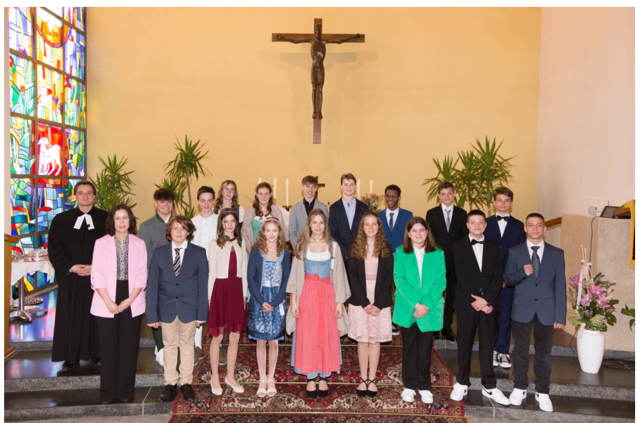
Evangelische Konfirmation 2023 in der Rosenau