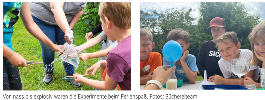
Von nass bis explosiv waren die Experimente beim Ferienspaß.