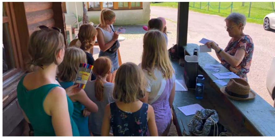
Am alten Sportplatz fand die Leserallye statt, die die Teilnehmer eifrig und rasch gelöst haben.

Obwohl es an diesem Tag sehr heiß war, konnten wir neun Kinder begrüßen, die ihr detektivisches Wissen an mehreren Stationen unter Beweis gestellt haben und schließlich auch einen Schatz, eine süße Abkühlung, gefunden haben. An der Leseinitiative des Landes haben sich viele fleißige junge Leseratten