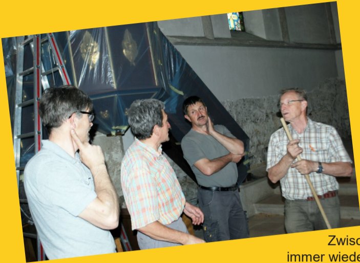
Zwischenzeitlich immer wieder Besprechungen