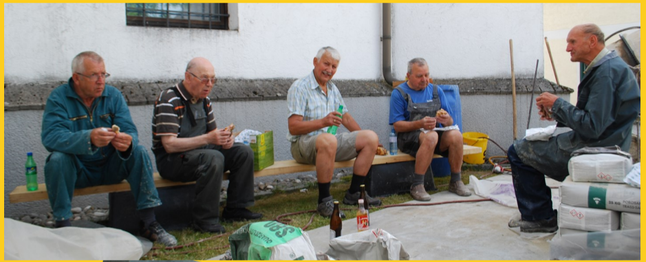
Auch eine Stärkung darf nicht fehlen.