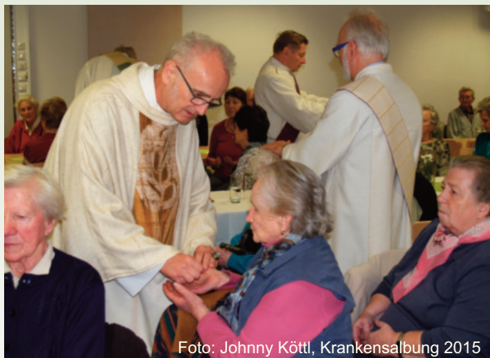
Krankensalbung 2015