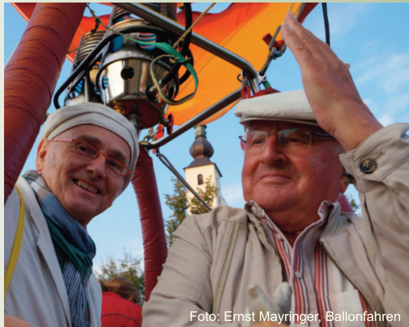
Ballonfahren