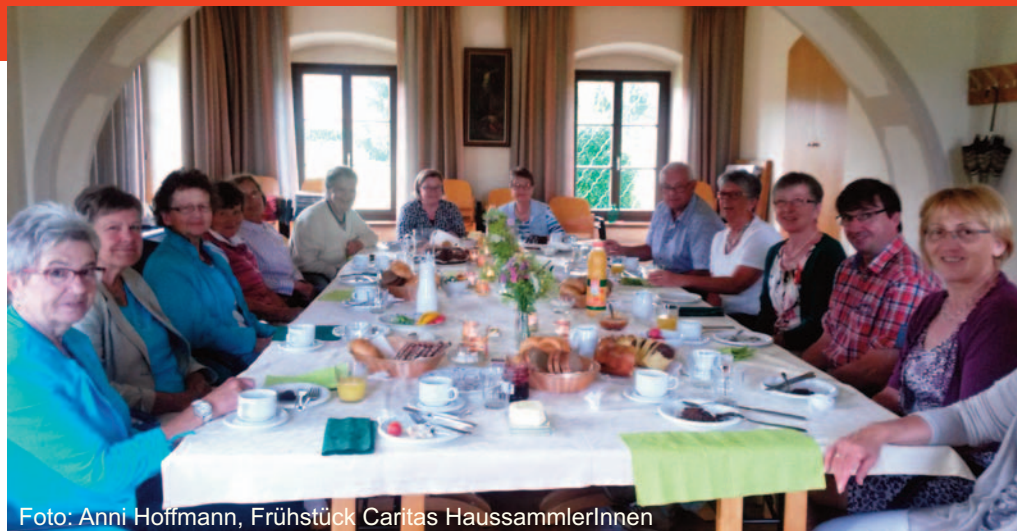
Frühstück Caritas HaussammlerInnen

MitarbeiterInnen für die Mithilfe und Unterstützung bei der Caritas-Haussaammlung noch einmal für ihren Einsatz herzlich bedanken. Das Teilen von Geld und Gaben, von Möglichkeiten und Chancen wird in einer Welt noch so perfekter Fürsorge notwendig bleiben. Auch in unserer Pfarre gibt es Personen, die unverschuldet, durch Wegrationalisierung ihres Arbeitsplatzes, durch Krankheit oder Scheidung in die Armutsfalle gera-