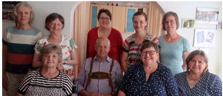
Unser Ferdl ist gerne der Hahn im Korb